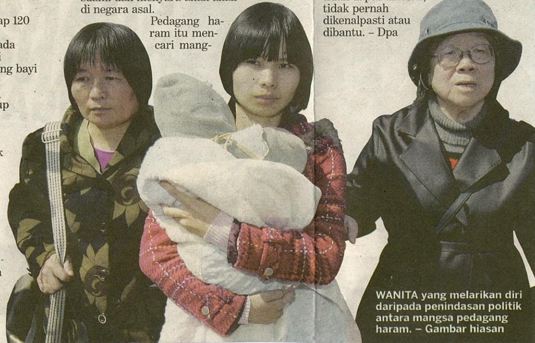
WANITA yang melarikan diri daripada penindasan politik antara mangsa pedagang haram. – Gambar hiasan

sa dalam kalangan wanita di sempadan. Wanita Korea yang melarikan diri akibat kelaparan dan penindasan politik contohnya mendapati diri mereka berakhir di tangan pedagang yang menjual mereka sebagai pengantin perempuan kepada lelaki China.